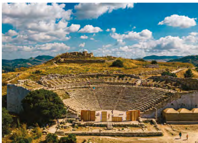
Tempio greco a Segesta, Sicilia

I Romani , nei secoli della dominazione latina, lasciarono poche tracce culinarie nella regione, sia per la forte impronta di dominazione violenta, sia perché consi-