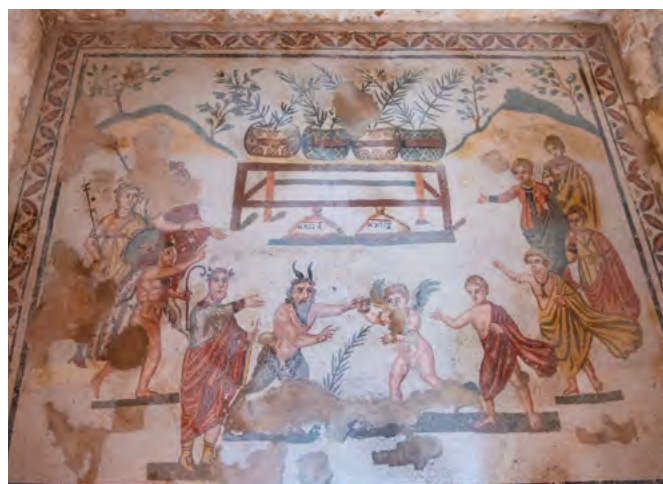
Villa romana a Casale, Sicilia