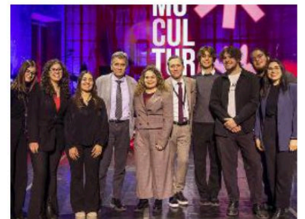
I giurati dell'Università di Camerino