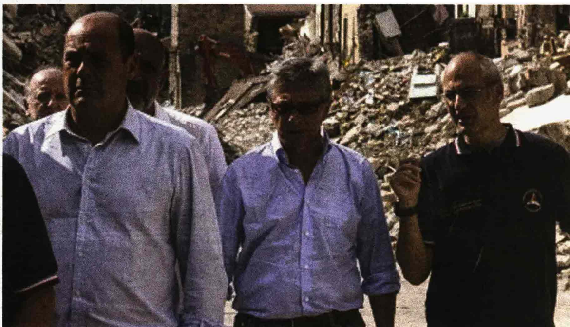
NERVI TESI Il commissario per la ricostruzione, Vasco Errani, col capo della Protezione civile, Fabrizio Curcio

Il premier Paolo Gentiloni sarà oggi nelle zone terremotate del Comune di Norcia: alle 15 visiterà le nuove casette di San Pellegrino di Norcia e alle 16 interverrà all'inaugurazione della 'Sagra del tartufo'